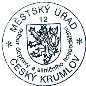
Vladimír Augsten referent ODaSH

Stavba nesmí být zahájena, dokud stavební povolení nenabude právní moci. Stavební povolení pozbývá platnosti, jestliže stavba nebyla zahájena do 2 let ode dne, kdy nabylo právní moci.